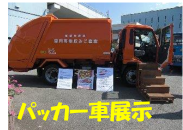
パッカー車展示 いつもお世話になっているのに、触れる機会の無い車。