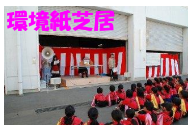
資源の大切さを伝える環境紙芝居。