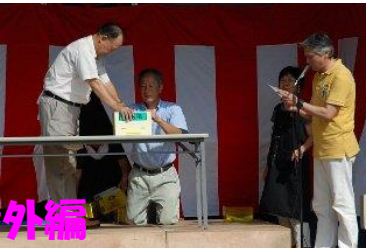
リサイクル広場番外編