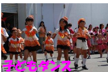
未来のトップダンサーたち。元気いっぱいに見せてくれました。