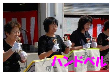
きれいな音色が響きわたりました。