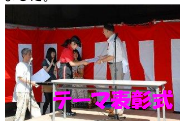
多くの応募の中より優秀賞を進呈。市民参加の手作りフェアとなった。