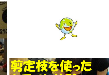
剪定枝を使ったクラフト体験