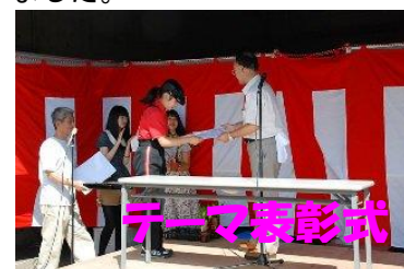
多くの応募の中より優秀賞を進呈。市民参加の手作りフェアとなった。