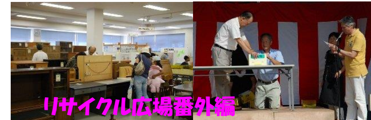
リサイクル広場番外編