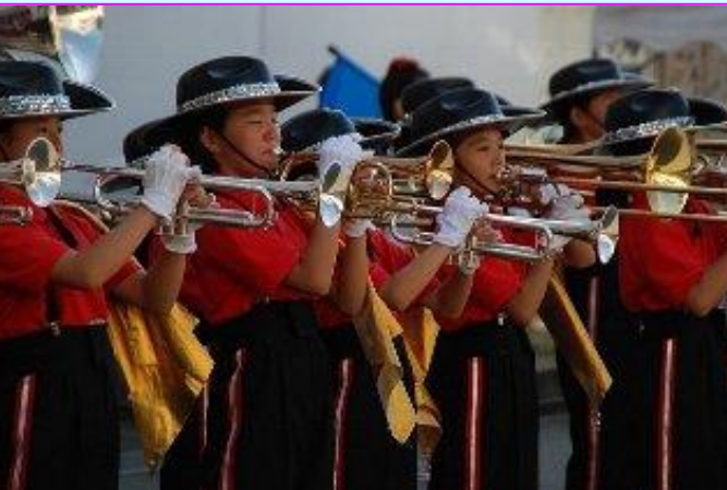
裾花小学校マーチングバンド部による、華麗で迫力のある演奏で開会。またステージでも感動させてくれました。

17回目を迎えた今回、晴天にも恵まれて、5,800人も市民の皆さんにおいでいただき、楽しんでいただくことができました。