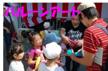
バルーンアートは、子どもたちに大人気です。